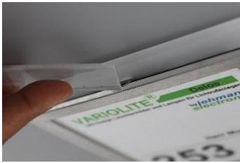
Halteklammer mit stumpfem Gegenstand zurückdrücken