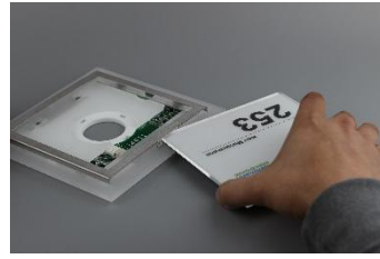
Mit der Acrylglasscheibe die Klammer zurückdrücken